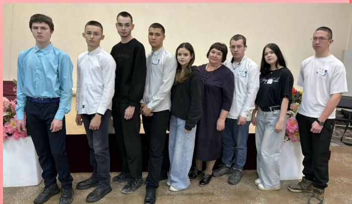
Волонтеры и медиациентр техникума