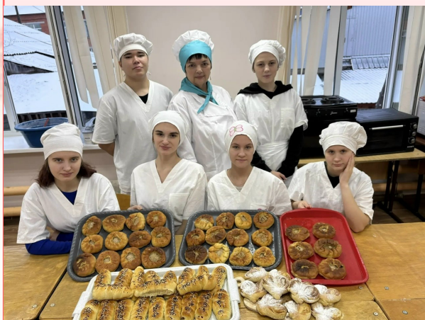
Обучающиеся 18-П группы «Пекарь»