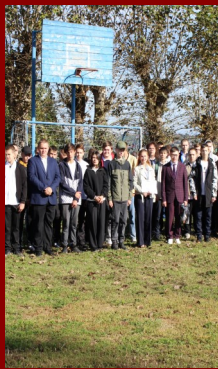
Торжественная линейка, посвященная началу учебного года

Этот праздник отмечают не только школьники. Для студентов профессиональных учебных заведений также прозвучит первый в этом учебном году звонок.