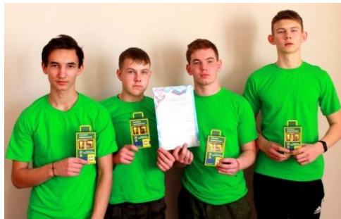
На фото победители (12 гр.)