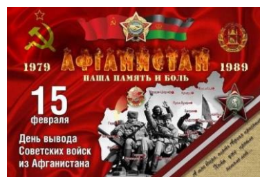
Викторина «Афганистан...Дни, ушедшие в вечность...»