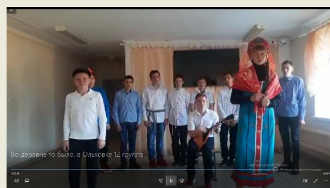
12 группа Сценка «Во деревне то было, в Ольховке»