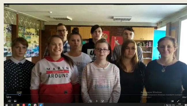
28 группа Песня «Маленькая страна»